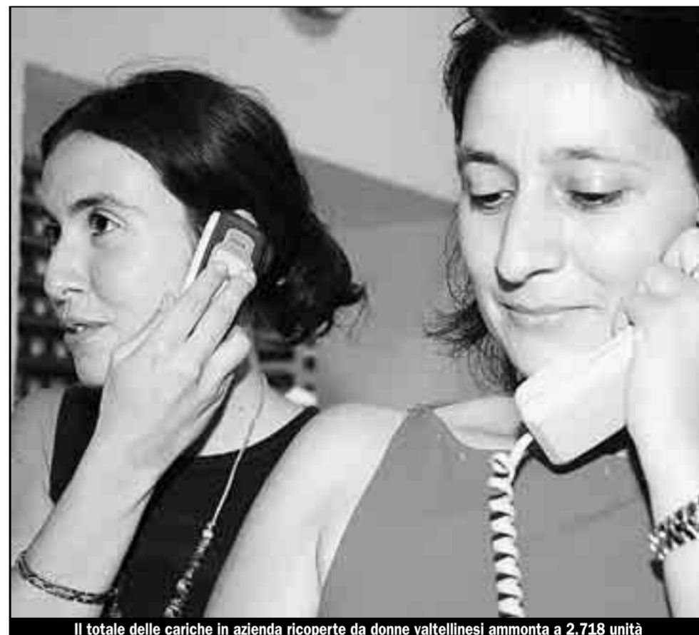
Il totale delle cariche in azienda ricoperte da donne valtelinesi ammonta a 2.718 unità

trattamenti. Molto probabilmente si tratta di un insieme di motivi, la ricerca scientifica sta compiendo al riguardo importanti passi in avanti». Tra le novità discusse nel corso della riunione, la predisposizione di nuovi protocolli di metodologie di intervento nella lotta alla varroa da concordare con la Asl che siano efficaci e rispettosi della qualità del miele. «E' molto importante - avverte Palmieri - rispettare i calendari dei trattamenti per evitare le reinfestazioni».